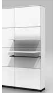
LEGPLANK MET HANGREK