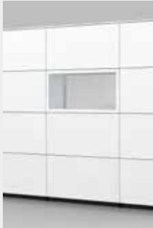
SCHAP MET DOORKIJK